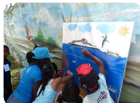
Découverte du régime alimentaire

Alain le garde de la réserve participe aux Ateliers de l'Environnement tous les mercredis de ces grandes vacances sur la pointe Buzaré. Ce projet à destination des centres aérés de la CACL permet d'initier les enfants non seulement à la beauté de l'île, mais aussi aux grandes problématiques liées au milieu marin. Ils ont pu ainsi découvrir les spectaculaires parades des Frégates