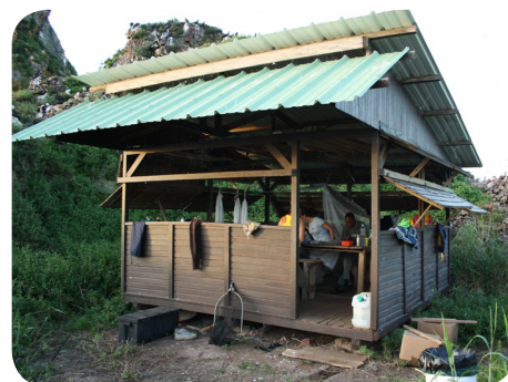
Carbet d'accueil