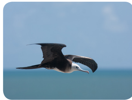
Immature de Frégate en vol

Fin juillet, une balise a émis un signal vers les satellites indiquant que le mérour équipé, alias Donald, ne s'est pas déplacé. Cinq autres mérours vont être suivis grâce à la même méthode entre août et décembre. Nous pourrions ainsi savoir si les mérours de Guyane quittent le territoire et où ils vont... Pour en savoir plus!