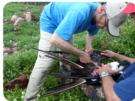
Prise de sang sur une Frégate