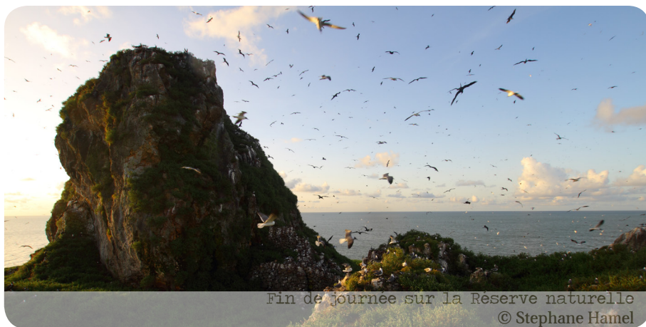
Fin de journée sur la Réserve naturelle

Relation entre contamination par polluant métallique et reproduction des oiseaux marins.